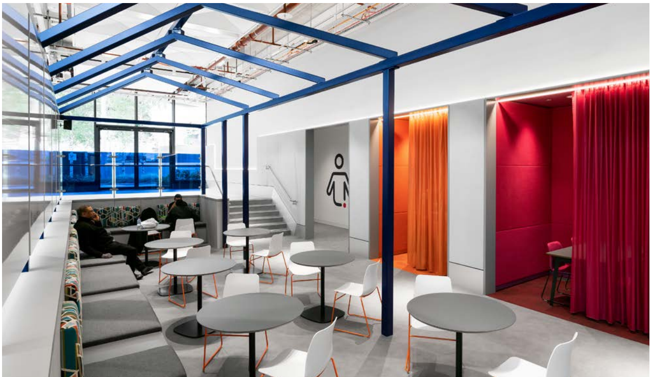
The number and configuration of meeting spaces were thoughtfully planned to meet the needs of staff.

L'approche axée sur les données adoptée par le British Council ne s'arrête pas une fois l'espace occupé. À Stratford, des capteurs enregistrent la station assise des employés sur certains meubles, les itinéraires les plus utilisés, et les zones grises. D. Bourke explique: « Nous verrons si la flexibilité professionnelle devient une réalité. Une même personne est-elle assise à ce bureau tous les jours, de 9 h à 17 h? Comment évolue la dynamique que nous souhaitons mettre en place? Certaines zones d'engagement social cultivent-elles les idées nouvelles? Et le bureau répond-il à cette attente? »