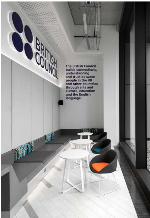
Casual seating welcomes visitors to reception.