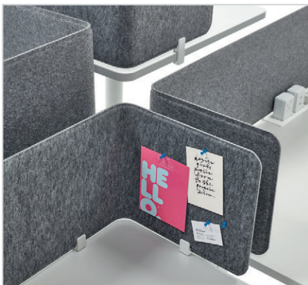
Trennwände für Arbeitsplatten