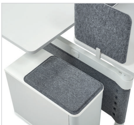
Stauraum mit Sitzfläche