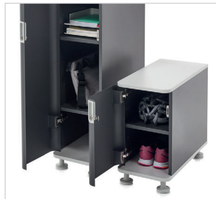
Optionen für persönlichen Stauraum